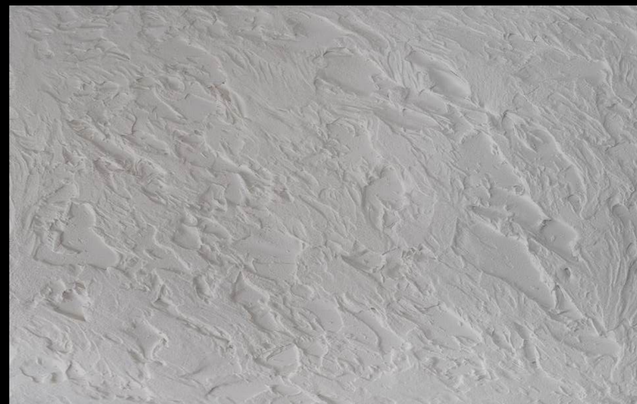
ARGILLA MATERICA EFFETTO NATURALE