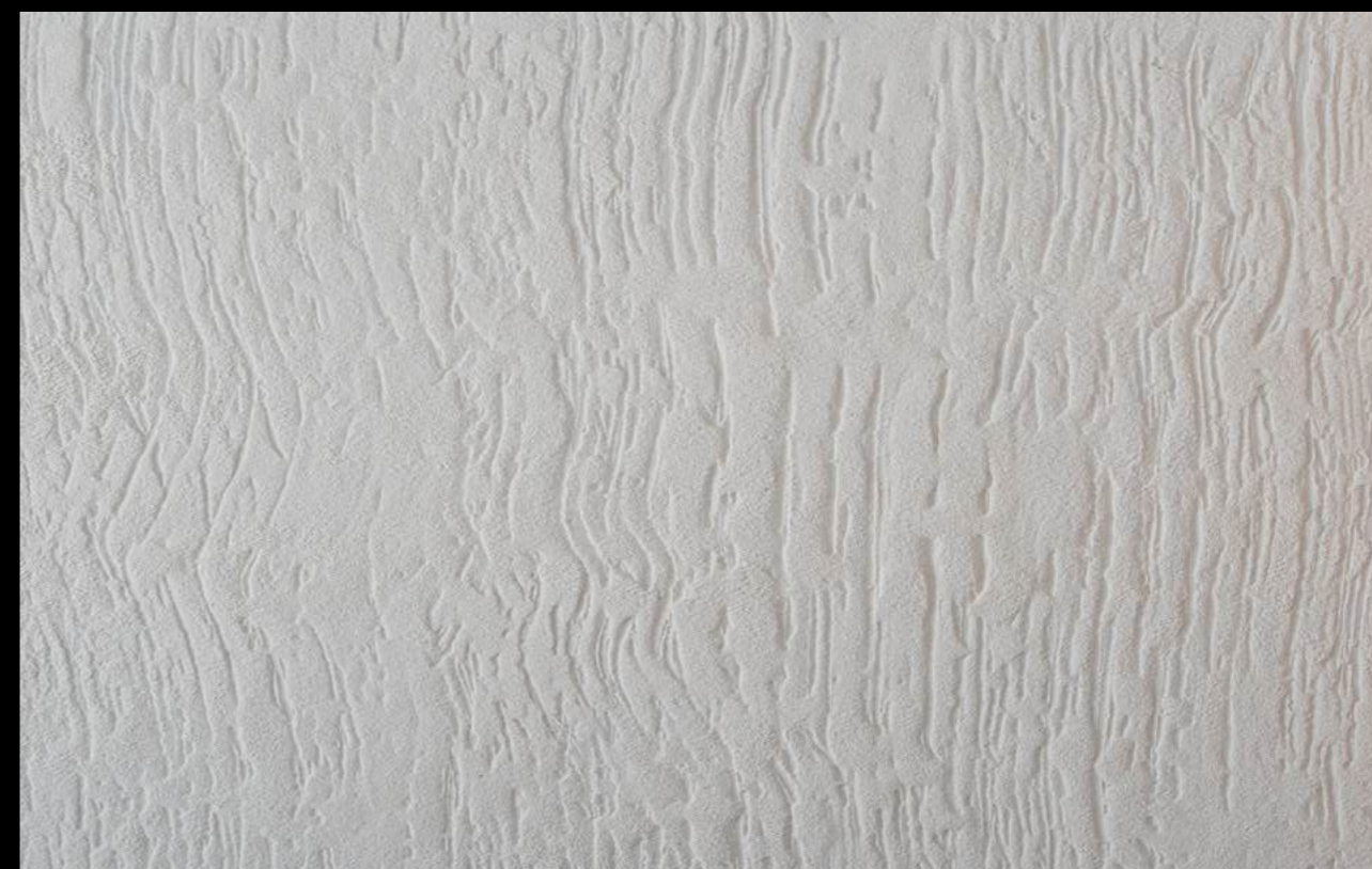
ARGILLA MATERICA EFFETTO GRAFFIATO